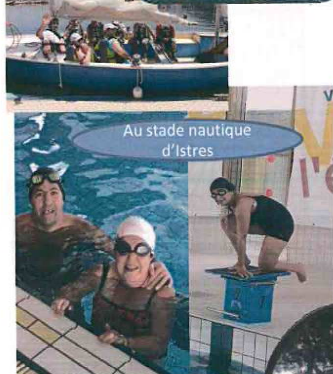
Au stade nautique d'Istres