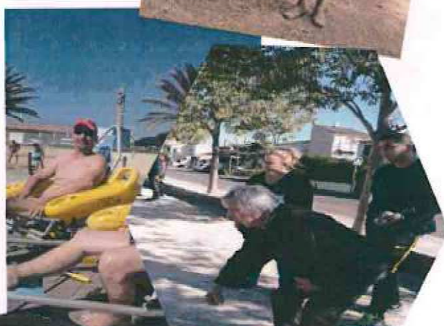
Tiralo et Journée Pétanque Avec le CCAS de Fos sur Mer