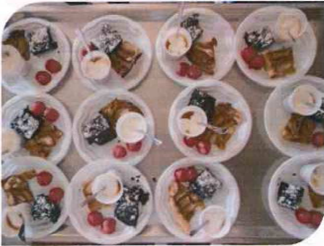
Atelier cuisine Les saveurs de l'été

L'accueil de jour ARF est une structure qui reçoit à la journée des personnes atteintes de la maladie d'Alzheimer ou apparentée, vivant à domicile. L'objectif est de maintenir l'autonomie et proposer des temps de répit aux aidants. Lors de l'accueil de la personne des activités adaptées lui seront proposées en fonction de ses goûts et de ses capacités cognitives et fonctionnelles.