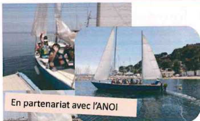
En partenariat avec l'ANOI